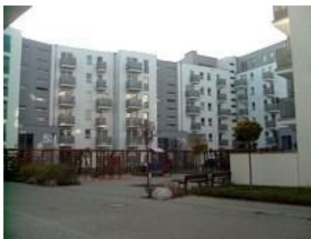
Wnętrze blokowe w budynkach z XXI w.