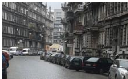
Typowe budynki zasobu gminnego na osiedlu Przedmieście Oławskie