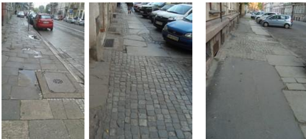
Typowe chodniki na bocznych ulicach osiedla Przedmieście Oławskie

Komentarze i przykład: Na głównych ulicach: Pułaskiego, Kościuszki, Krakowska, Traugutta, Podwale są dobre chodniki z kostki betonowej. Na Podwalu przy konsulacie niemieckim jest zwężenie i barierki poprzeczne. Na pozostałych ulicach chodniki to patchwork z zabytkowych płyt kamiennych uzupełnianych kostką kamienną i miejscami asfaltem. Nawierzchnia niezbyt równa, zwłaszcza przy studzienkach telefonicznych i okienkach piwnic. Na osiedlu domków jednorodzinnych Rakowiecka/Okólna (Niskie Łąki) częściowo brak chodników.