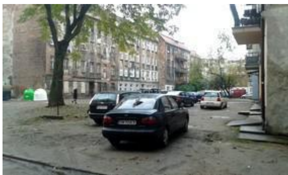
Wnętrze blokowe budynków z XIX w.